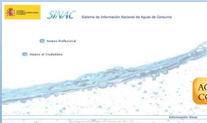
AGUAS DE CONSUMO HUMANO