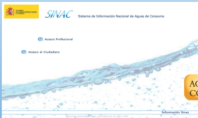
AGUAS DE CONSUMO HUMANO