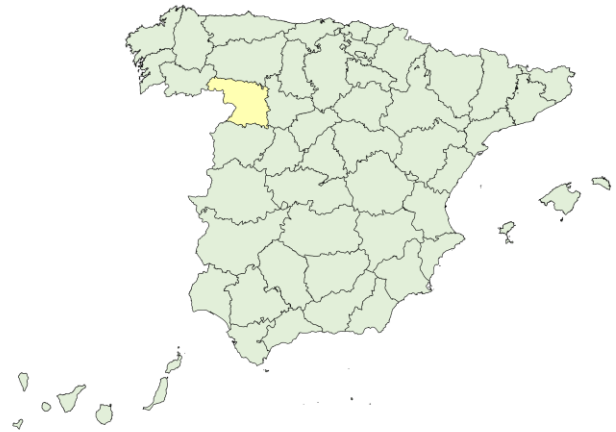
Incidencia acumulada (≥60 años) en 7 días (02/03/2023 - 08/03/2023)