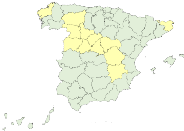
Nuevos ingresos COVID-19 por 100.000 en camas de agudos, a 08/03/2023