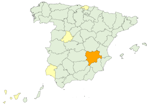
Nuevos ingresos COVID-19 por 100.000 en camas UCI, a 08/03/2023

Tasa nuevos ingresos ■ <0.5 ■ 0.5-1.5 ■ 1.5-2.5