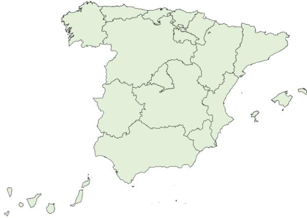
Incidencia acumulada (≥60 años) en 14 días (23/02/2023 - 08/03/2023)