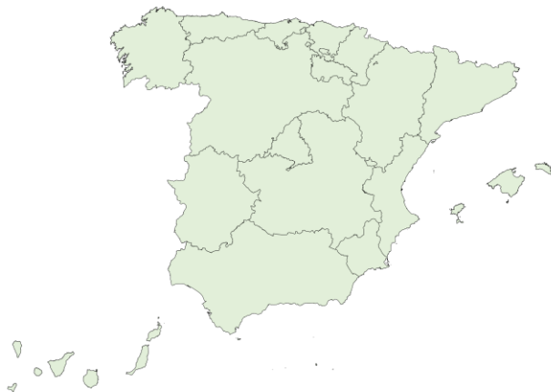
Tasa ocupacion COVID-19 por 100.000 en camas de agudos, a 08/03/2023