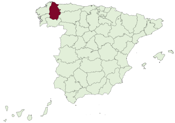
Ocupación de camas de UCI por COVID-19, a 08/03/2023