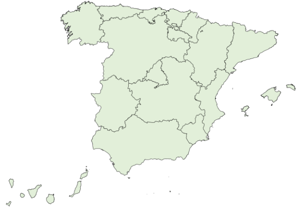
Incidencia acumulada (≥60 años) en 7 días (02/03/2023 - 08/03/2023)