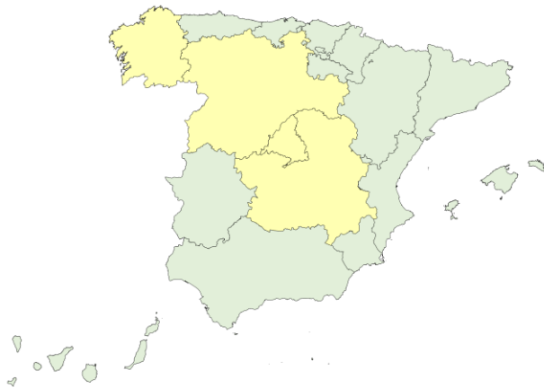
Nuevos ingresos COVID-19 por 100.000 en camas de agudos, a 08/03/2023