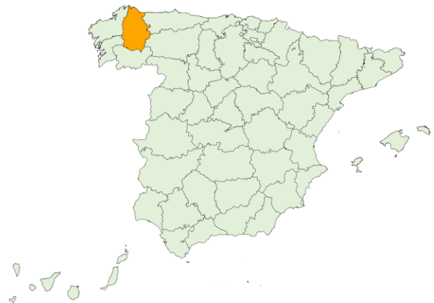
Tasa ocupación COVID-19 por 100.000 en camas UCI, a 08/03/2023