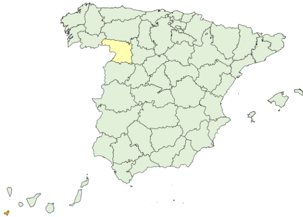
Incidencia acumulada (≥60 años) en 14 días (23/02/2023 - 08/03/2023)