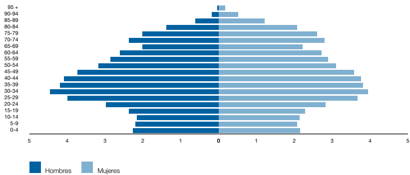
Figura 1. Pirámide de población, 2007 (Aragón)

Revisión del padrón municipal de habitantes a 1 de enero de 2007. Instituto Aragonés de Estadística.