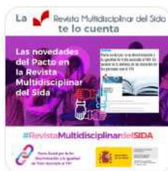
Revista multidisciplinar del sida

https://pactosocialvih.es/campanas-pacto-social-vih/