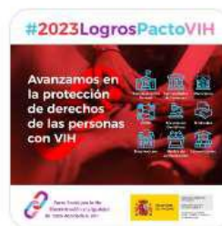
Logros Pacto Social VIH