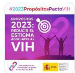
Propósitos Pacto Social VIH