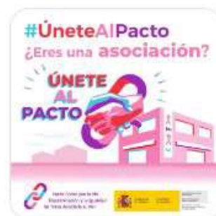
Únete al Pacto Social VIH