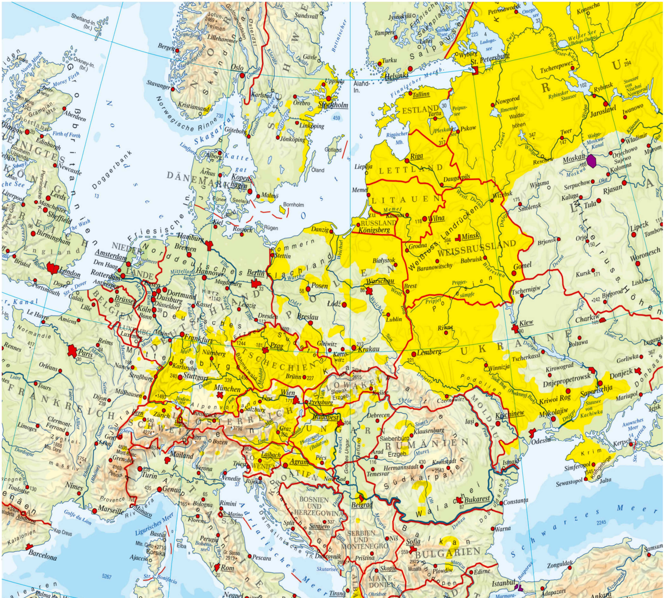
Distribución zonas de riesgo de Encefalitis por garrapatas en el cinturón forestal euroasiático.