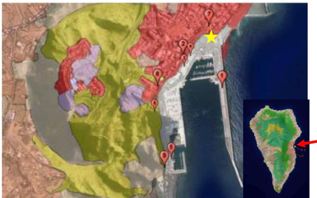
Figura 1. Localización del lugar donde se encontró una ovitrampa con larvas de Aedes aegypti (estrella amarilla) y otras zonas de muestreo en el Puerto de Santa Cruz de La Palma

Flecha roja: puerto de Santa Cruz de La Palma donde se encuentran repartidas 32 ovitrampas y 1 trampa para la captura de mosquitos. En la imagen ampliada se indica la zona de detección del mosquito (estrella amarilla) así como las zonas muestreadas (1-9): terminal de pasajeros (1), punto de inspección fronteriza (3), terminal de contenedores (4), dársena pesquera (5), entorno urbano del punto de entrada (2,6,7,8 y 9). Se muestra capa de usos del suelo: recinto portuario (gris), suelo urbano (rojo), suelo desnudo (amarillo), zona suelo desnudo (en violeta).