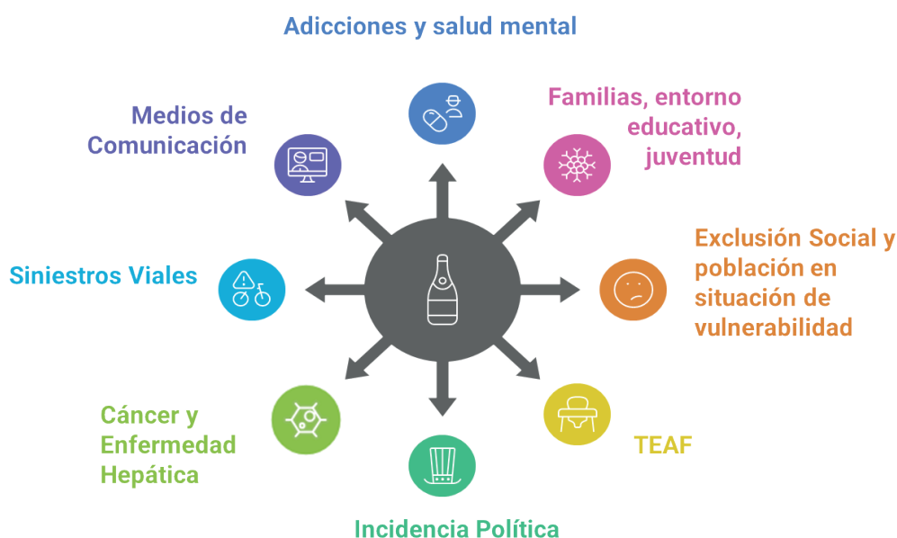
Figura 1: Ámbitos en los que trabajan las entidades del tercer sector que han participado en el encuentro

Han participado entidades de ámbitos muy diversos, tanto a nivel internacional y nacional, como regional, local y de barrio. En la figura 1 puede verse los diferentes ámbitos de los que provenían. Entre todas realizan actuaciones que van desde la incidencia política, la prevención en diversos ámbitos (escuelas, jóvenes, familias, etc.), la investigación, divulgación, el apoyo a personas en situación de vulnerabilidad (y en situación de calle), apoyo a las personas con trastornos por consumo de alcohol u otras adicciones (tratamiento, rehabilitación, apoyo en salud mental), dando apoyo también a las familias y su entorno. Entidades que trabajan la prevención de la exposición al alcohol en el embarazo y de familias de niño/as y personas con Trastornos del Espectro Alcohólico Fetal (TEAF). Las que trabajan por reducir la toxicidad del alcohol a nivel hepático y también en la lucha contra el cáncer, las que abordan el tratamiento mediático de las adicciones o en la prevención de siniestros viales. Incluyendo representación de asociaciones de Población Gitana.