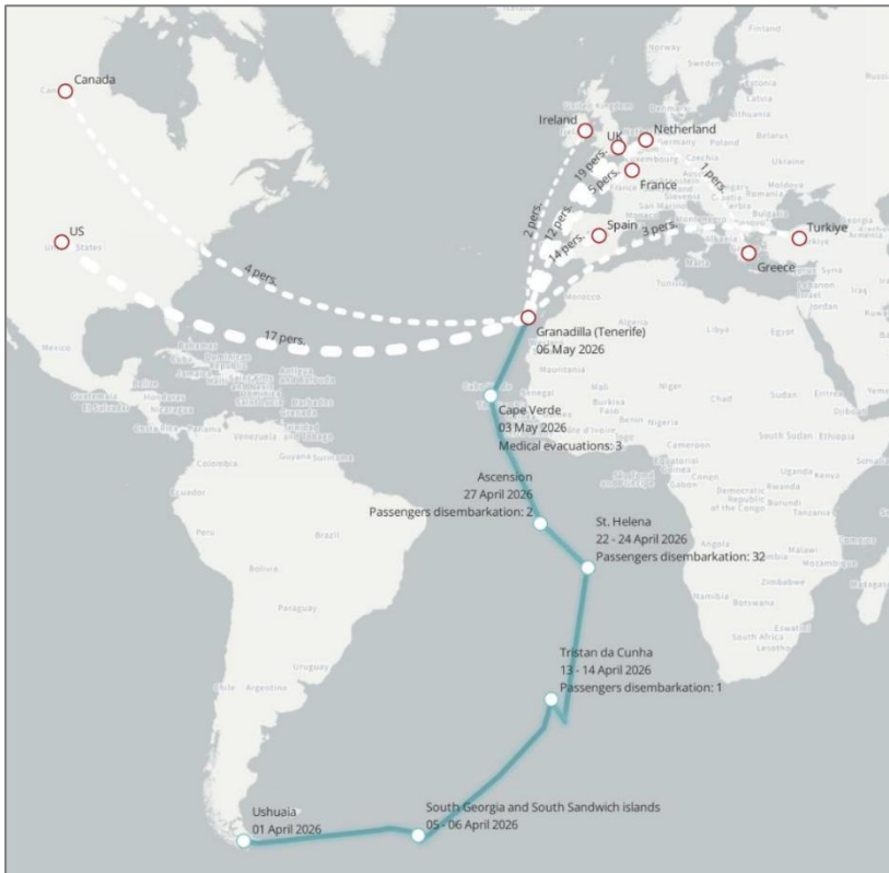
Figura 1. Trayecto del barco, desembarcos y evacuaciones, entre el 1 de abril y el 11 de mayo de 2026.