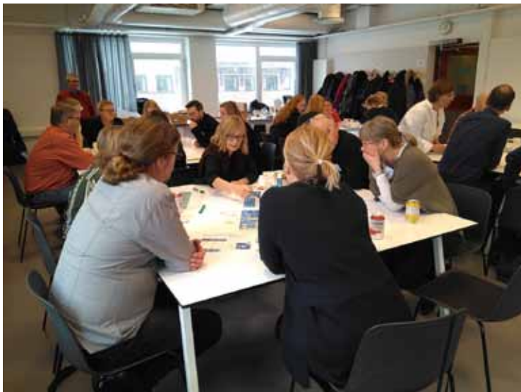
Figura 1 Taller de diseño colaborativo. Centre for Healthcare Architecture. Chalmers University of Technology, Göteborg, Suecia.

A diferencia del equipo de un diseño tradicional (formado por el cliente o sus representantes, los planificadores, el equipo de arquitectura, el equipo de ingeniería y los contratistas), el equipo necesario para poder aplicar el proceso de diseño basado en evidencias es mucho más extenso (11) . Este equipo interdisciplinar (figura 1) se compone de un conjunto mayor de personas que incluye tanto a propietarios (equipo directivo y ejecutivo de las distintas áreas de