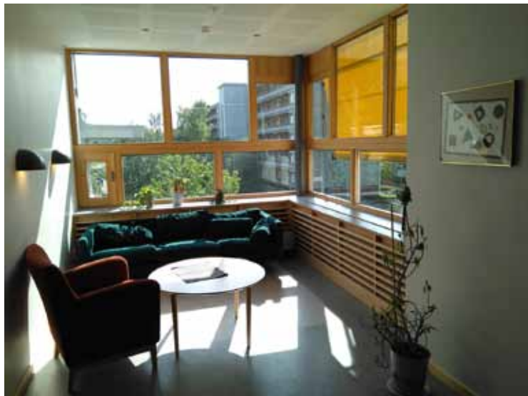
Figura 3 Sala de estar para pacientes en la unidad psiquiátrica del Östra Hospital (Gotemburgo, Suecia) diseñado por White Arkitekter.

Uno de los mayores escépticos a este proceso es Stefan Lundin, arquitecto en White Arkitekter y responsable del diseño de la unidad de psiquiatría en el Östra Hospital de Gotemburgo (Suecia) (figura 3). Cuando el psicólogo ambiental Roger Ulrich, autor del primer artículo científico, conoció este hospital psiquiátrico, quedó asombrado al ver cómo se habían incorporado distintas estrategias de diseño avaladas por el diseño basado en evidencias (13) , como iluminación natural, vistas a la