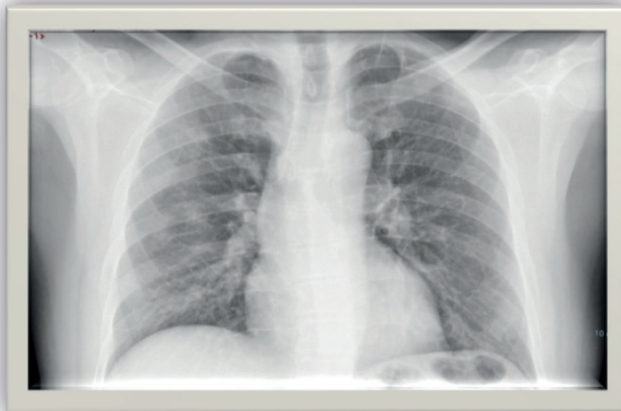
Figura 2 Radiografía PA de Tórax obtenida del paciente en el ingreso hospitalario. Infiltrado intersticial bilateral por SARS-CoV-2.

Se ven opacidades “parcheadas” y en “vidrio deslustrado” en parénquima periférico de hemitórax derecho. Prominencia intersticial axial muy discreta.