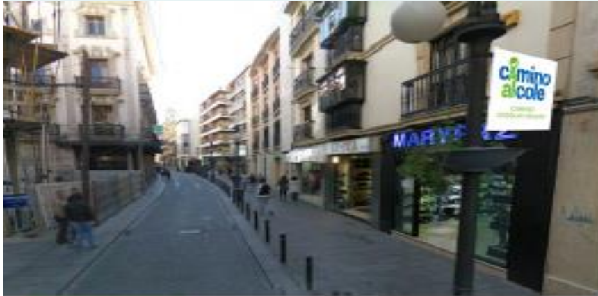
Banderolas C/ Concepción