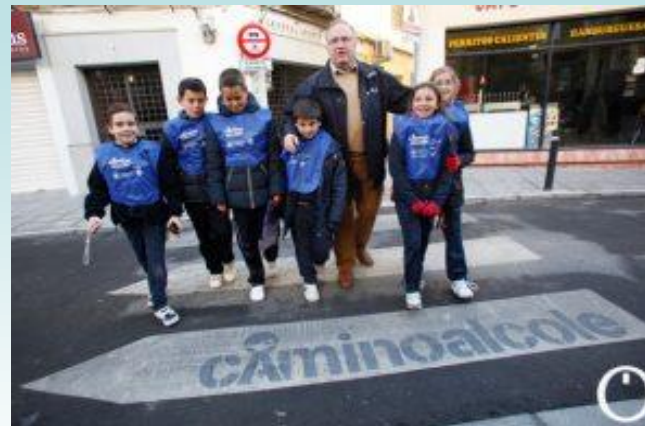
Señalización en Paso de Peatones