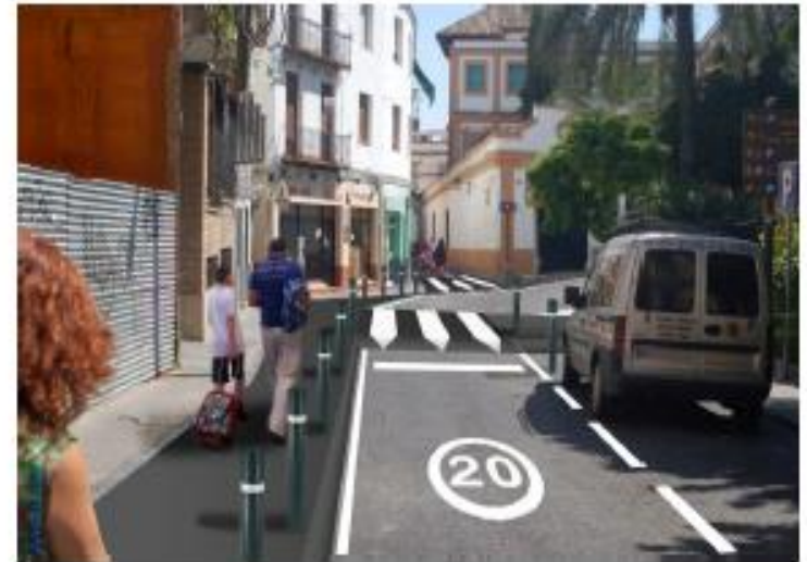
Corredor Escolar "Plaza Ramón y Cajal"