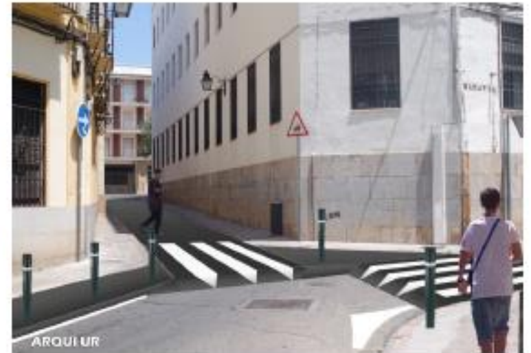
Corredor Escolar "Las Esclavas"