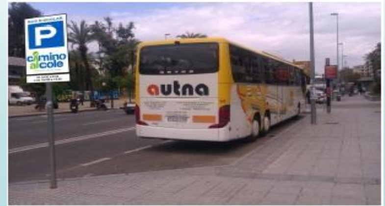
Señalización aparcamientos transporte escolar y Padres/Madres