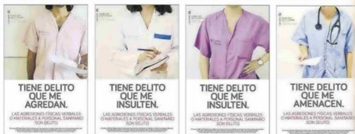
Posteros de la campaña que ha distribuido el Área de Salud para prevenir las agresiones, insultos y amenazas.

Fecha: 11/06/2021 Audiencia: 10.577 Sección: LOCAL Vpe: 1.215 € Tirada: 3.578 Frecuencia: DIARIO Vpe pág: 2.519 € Difusión: 3.022 Ámbito: PRENSA DIARIA Vpe portada: 4.533 € Ocupación: 48,25% Sector: INFORMACION GENERAL